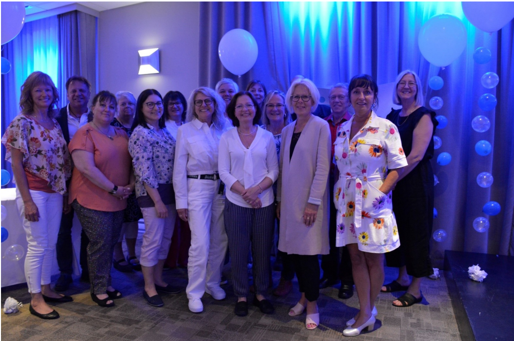
Soirée hommage aux retraité(e)s le 2 juin 2023.