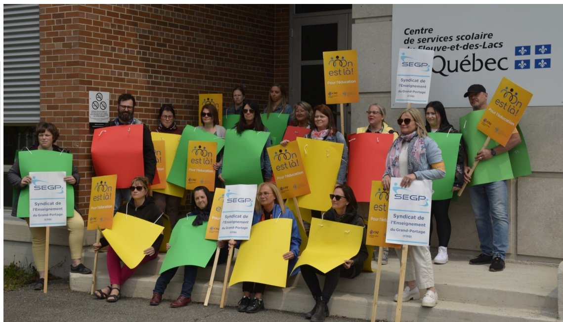
Action composition de la classe devant les bureaux du Centre de services scolaire du Fleuve-et-des-Lacs, le 19 mai 2023.